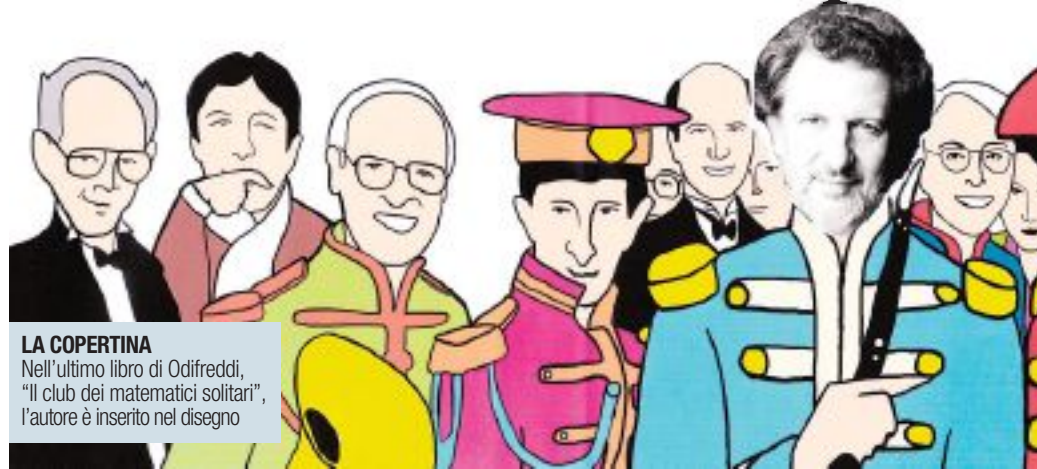
LA COPERTINA Nell'ultimo libro di Odifreddi, "Il club dei matematici solitari", l'autore è inserito nel disegno

La matematica non è poi quello spauracchio temuto dalla stragrande maggioranza degli studenti. Anzi, se presa con lo spirito giusto può trasformarsi in un divertente passatempo, un gioco. Il ragionamento non fa una grinza per Piergiorgio Odifreddi, matematico e saggista italiano, curatore di quel "Il club dei matematici solitari" che attirato folle e tifo da stadio nei festival che li ha ospitati. "Naturalmente parliamo di festival di matematica, che stanno vivendo un vero e proprio boom - spiega al Caffè l'autore de "Il matematico impertinente" - Come del resto hanno successo spettacoli, libri e film che vedono la matematica come protagonista. L'importante è non confonderla con la numerologia, che non ha niente a che vedere con la scienza della matematica, anche se può offrire divertenti