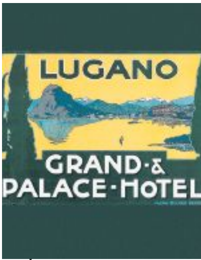
GRANDI ALBERGHI Il più lussuoso, all'epoca, albergo di Lugano

Tra il 1880 e il 1912 s'inaugurarono in Ticino 200 hotel, nemmeno le due guerre riuscirono a fermare il turismo