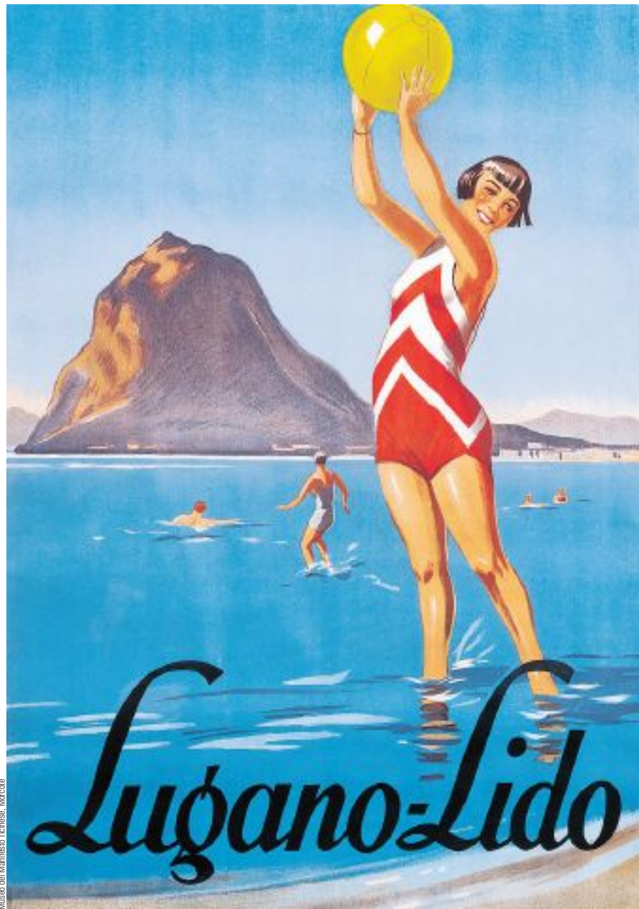
Museo del Manifesto Ticinese, Morcote