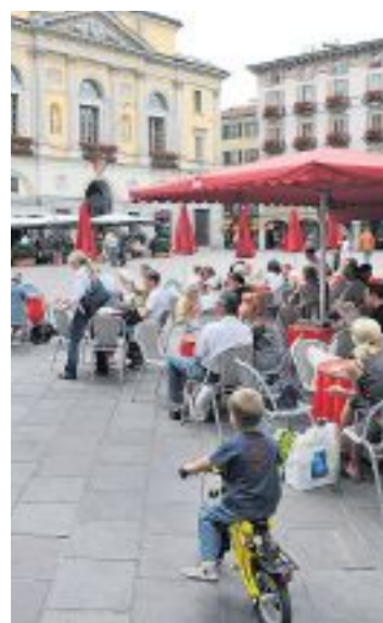
SOGNANDO DOMANI Piazze piene di turisti e un cantone animato