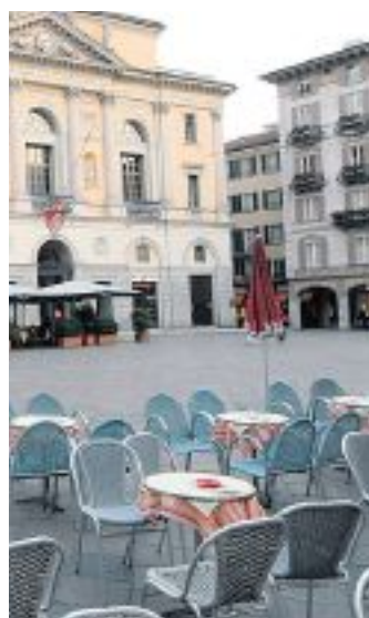
FUTURO DESOLANTE Pochi affari per alberghi e ristoranti, economia depressa

per la clientela d'affari, che in ogni Paese è un segmento molto importante per il turismo. Nel Locarnese, e penso in particolare ad Ascona, si è fatto altrettanto per il turismo residenziale di alto profilo. Sono elementi fondamentali per migliorare la nostra capacità di accoglienza". Punti forza, insomma, che assieme a quel tessuto di eventi e d'iniziativa culturale di richiamo possono dare una spinta al rilancio. "A patto avverte - Solari - che la si finisca con i