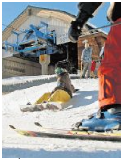
SULLA NEVE Bosco Gurin nella stagione record del 2008. Ma non basta ancora...