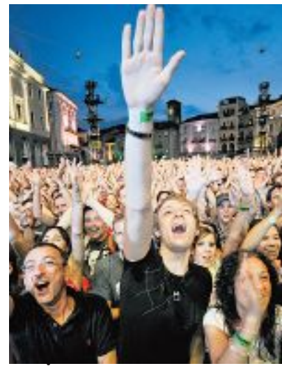
AI CONCERTI Locarno con il suo "Moon and Stars" attira migliaia di spettatori