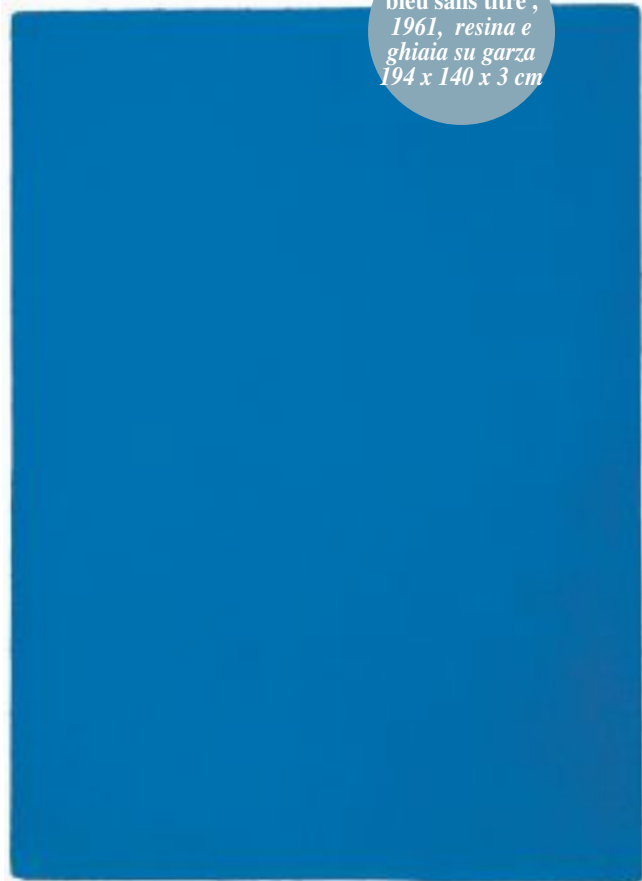
Monochrome bleu sans titre, 1961, resina e ghiaia su garza 194 x 140 x 3 cm

Ci soffermiamo qui su Klein: una meteora fulgida e fugace nei cieli dell'arte degli anni '50, la cui luce brilla intatta ancor oggi. Nato nel '28 a Nizza e morto a Parigi nel '62, a soli 34 anni, tutta la sua storia artistica si concentra tra il '54 e il '62: in quegli otto anni Klein ha bruciate le tappe di un cammino secolare (quello del '900), portando radicalmente avanti, attraverso una serie di opere o di gesti esemplari, fisici e concettuali ad un tempo, il problema dell'essenza dell'arte come definitivo superamento dei suoi limiti storici: figurati, illusionistici, narrativi.