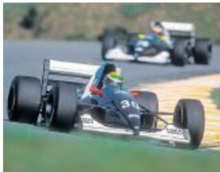
LA SCUADERIA Ad inizio anni Novanta, Sauber sbarca in Formula1 con la sua scuderia. Nella foto, JJ Lehto ottiene il 5. posto sul circuito sudafricano di Kyalami. È l'anno 1993